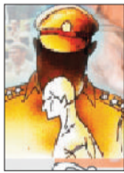
भटकते रहे अधिकारी

अधिकारी व थानेदारों का अलर्ट कर पतासाजी करने का निर्देश दिया। राजपत्रित अधिकारी व थानेदार अपने अपने क्षेत्र में गोली लगाने वाले की तलाश में इधर उधर भटकते रहे और अपने अपने क्षेत्र के सिस्टम, जिला अस्पताल, अपोलो, निजी हास्पिटल में पूछताछ करने में लगे। काफी मशकत के बाद भी गोली चलने की पुष्टि नहीं होने पर सूचना देने वाले वेब पॉर्टल पत्रकार से अधिकारियों ने पूछताछ की तो वे अलग अलग नाम बताकर सूचना देने की बात कहने लगे। रात 9 बजे तक शहर में गोली चलने की पुष्टि नहीं हो पाई, उसके बाद गोली चलने की अफवाह होने पर अधिकारियों ने राहत की सांस ली।