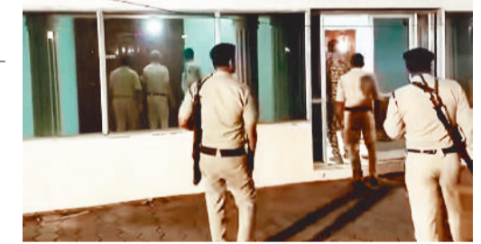
जांच करती पुलिस।