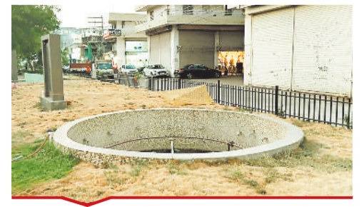
पुराना बस स्टैंड शिव टाकीज रोड के किनारे स्थित फौवारा बंद।

[ बिल्हा | मस्तूरी | तखतपुर | मुंगेली | कोटा | लोरमी | सरगांव | पेंड़ा | बेलतरा | रतनपुर | पथरिया ]