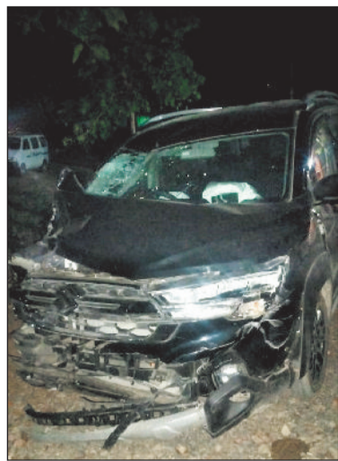
जाया गया, जहां इलाज के दौरान दोनों युवकों की मौत हो गई। बताया जा रहा है कि हादसे में

एक बार फिर क्षेत्र में तेज रफतार का कहर देखने को मिला है। मुंगेली-बिलासपुर नेशनल हाइवे पर जिला पंचायत धरमपुरा के समीप 13 अप्रैल को हुए भीषण सड़क हादसे में एक युवक की मौके पर ही मौत हो गई, जबकि दो अन्य गंभीर रूप से घायल हो गए, जिनकी इलाज के दौरान मौत हो गई। घटना के बाद क्षेत्र में अफरा-तफरी का माहौल बन गया और मौके पर लोगों की भारी भीड़ जुट गई।